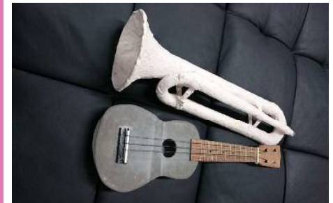
コンクリート製楽器の音色を聞いてみよう!