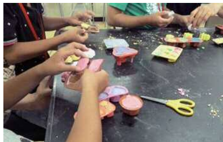
セメントオブジェを作ってみよう!