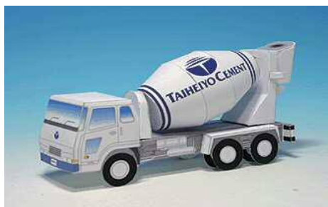
紙でコンクリートミキサー車を作ろう!