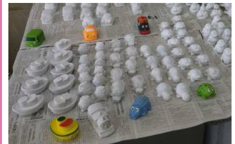
コンクリートに色を塗ってみよう!