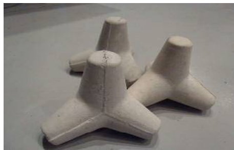
ミニテトラポッドを作ってみよう!