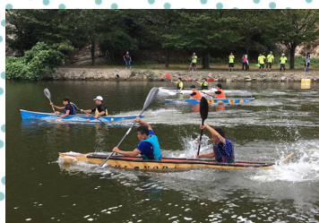
2018年第19回大会の様子