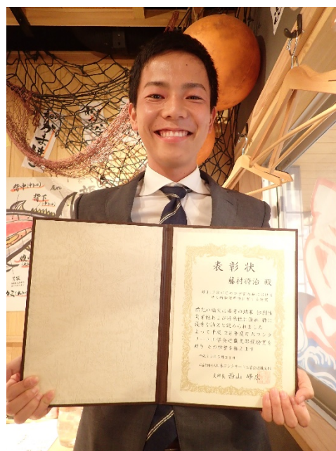
藤村氏（別日に授与、撮影）